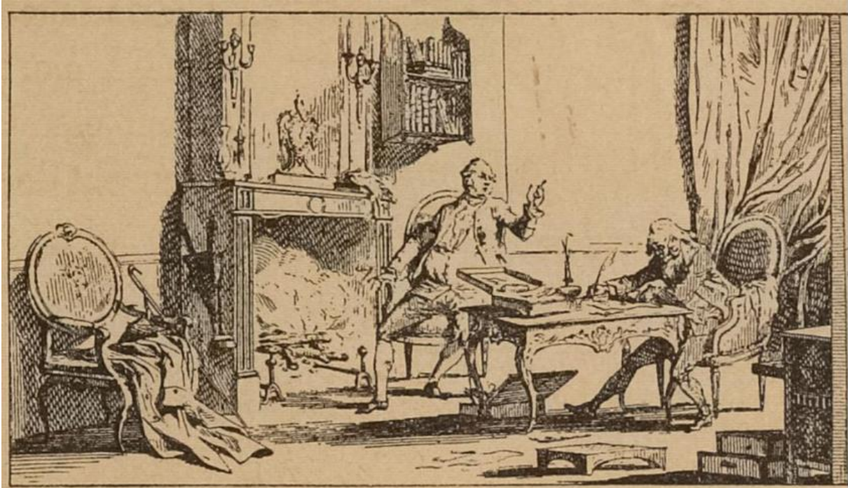
Fig. 29. — Louis XVI dictant sa défense à Malesherbes.

Baugniet a pu s'inspirer de cette gravure anonyme. Musée Carnavalet ; Histoire de Paris, numéro d'inventaire G.28677 :